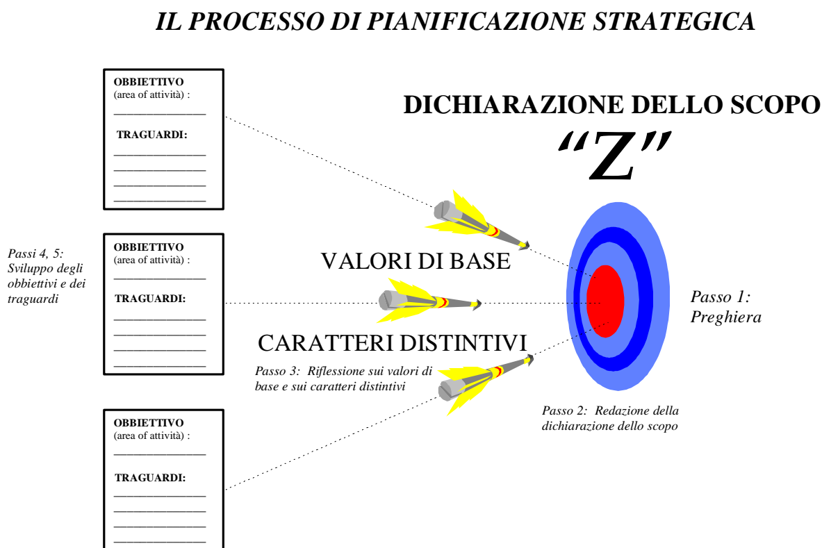
Figura 4.1 Il processo di pianificazione strategica

È importante tenere sempre bene a mente che i piani strategici che risultino da questo processo non sono immutabili. Piuttosto, sono una pianificazione di lavoro che contiene ciò che voi e le vostre squadre considerate, in quel dato momento, essere le migliori cose da fare, in modo da procedere verso la vostra strategica “Z”, o obiettivo finale. Nel cominciare a mettere in pratica quelle attività che avete definito nel vostro piano, potreste trovare altre questioni che vi portino a modificare il vostro piano strategico. Per questo è importante rivedere il vostro piano strategico a scadenza regolare. Un piano è utile soltanto se vi aiuta a vivere in maniera più mirata e a mantenere il vostro ministero più concentrato sulle attività più importanti.